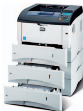
Abbildung enthält Optionen.